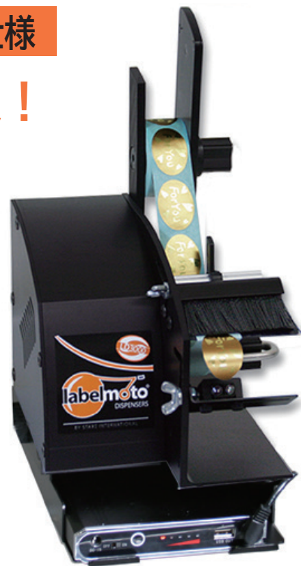
<製品仕様> ラベルディスペンサー バッテリーパック仕様 LD3000-BP

※商品にロールラベルは付属してません ※上記表の個装の寸法と質量は、出荷時形態を記載しています。